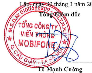
Tô Mạnh Cường