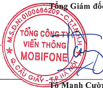
Tô Mạnh Cường